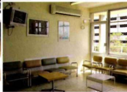
חדר ההמתנה לפני השיפוץ ואחריו