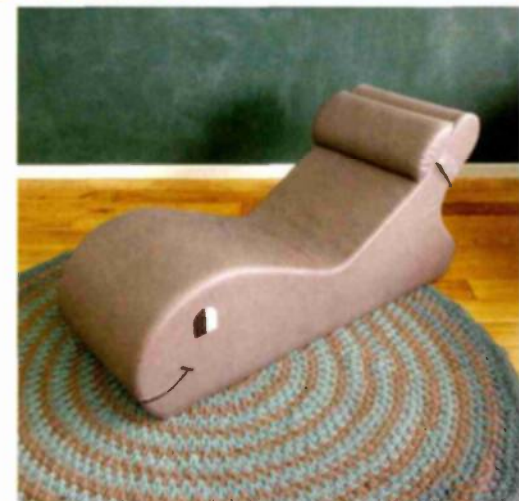
בתמונות: עיצוב חמים ומוקפד

הביאה את בר אור לחבור אליהם כשותפה מלאה לתהליך, להעמיד לרשותם את ניסיונה המקצועי ולהירתם למימוש הפרויקט משל היה פרויקט פרטי לכל דבר המטופל במשרדה. אף בית החולים שיתף פעולה עם היוזמה הברוכה, הן בהקצאת סכום כסף, והן בכל הקשור להיבטים מעשיים כאישורים נדרשים וכיו"ב, אך עדיין חסרו לא מעט משאבים למימושה הרצוי. הפנייה הראשונה, מספרים כל המעורבים בתהליך, הייתה לחברת PARQUETEAM, שתרמה את פרקט העץ הגושני המשמש לריצוף החלל, והיענותה המידית הייתה בבחינת סימן טוב לבאות- ומכאן ואילך